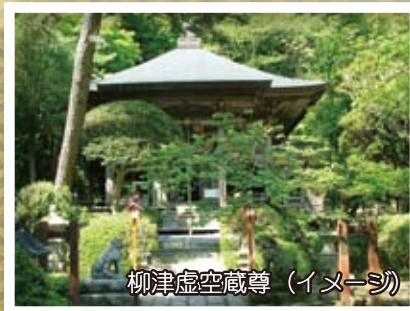
柳津虚空蔵尊 (イメージ)