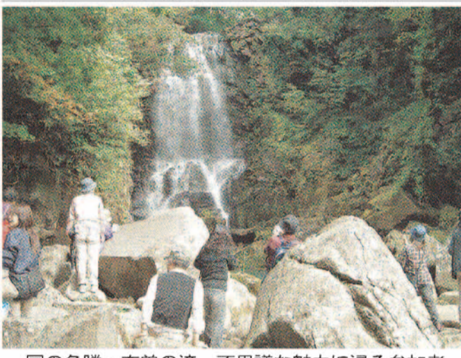
国の名勝・奈曾の滝。不思議な魅力に浸る参加者

絶景鳥海山を軽ハイキング。通旅で自然満喫。六回目は通旅「紅葉の鳥海山と日本海に沈む夕陽」。