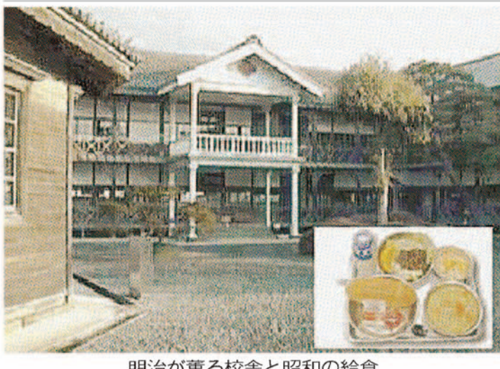
明治が薫る校舎と昭和の給食