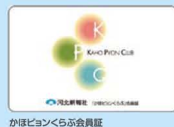
かほピョンくらぶ会員証

特典を利用することで来店回数を増やしたり、イベントや会員限定企画で新規客の開拓などにつなげます。